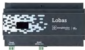
Dynamisches Lastmanagement Lobas