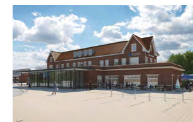
Bahnhof Nordhorn, Nordhorn, Regeneratives Energiekonzept, 2022