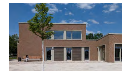
Freizeitzentrum Baumheide, Bielefeld, Energetische Ertüchtigung, 2022