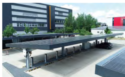
Jungheinrich AG, Hamburg, Solarparkplatz an der Konzernzentrale, 2020–2023