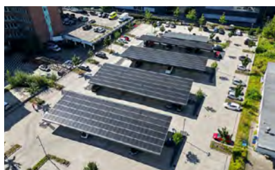
Jungheinrich AG, Hamburg, Solarparkplatz an der Konzernzentrale, 2020–2023