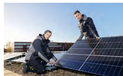
Müller-BBM Industry Solutions GmbH, Gelsenkirchen, Installation PV-Dachanlage, 2023