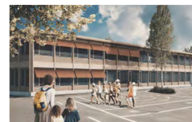
Offene Ganztagsgrundschule Heiligenhaus, Overath, Neubau und Sanierung, 2022